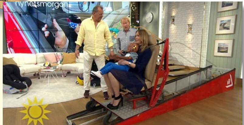
Trafiksäkerhetsinformation till alla! Vi medverkade i Nyhets Morgon i TV 4 och informerade om vikten av att använda bilbältet.