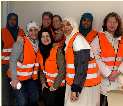
Trafiksäkerhetsinformation till asylsökande kvinnor i Flen.