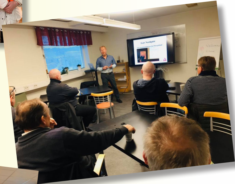
Trafiksäkerhetsinformation till taxichaufförer på Södertälje Taxi AB. Totalt informerades 130 st chaufförer vid tre tillfällen.