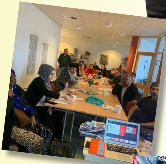
Trafiksäkerhetsinformation till asylsökande i Vingåker.